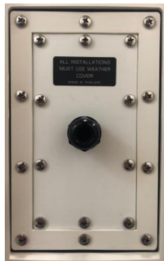
防水コネクターカバー 耐候性能：IP68 ※写真は 108HTH