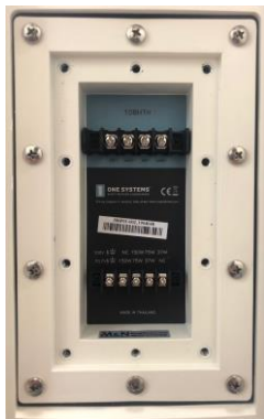
パリアストリップコネクター ※写真は 108HTH